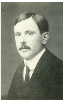
Robert William Seaton Watson