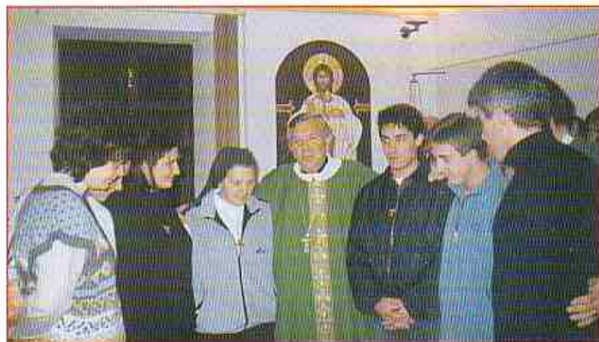
Biskup s mladeži koja putuje u Brazil, nakon blagoslova ikone

Hvala ti, Oče, što si me i danas uporabio kao oruđe!