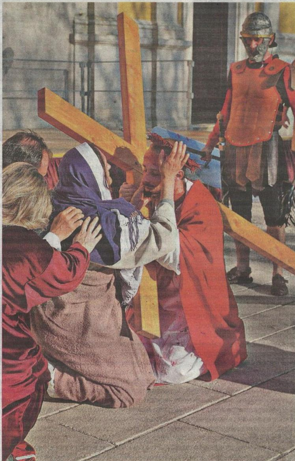
Muku su u Svetom Petru u Šumi uprizorili članovi zaprešičke udruge »Stepinčeva oaza«